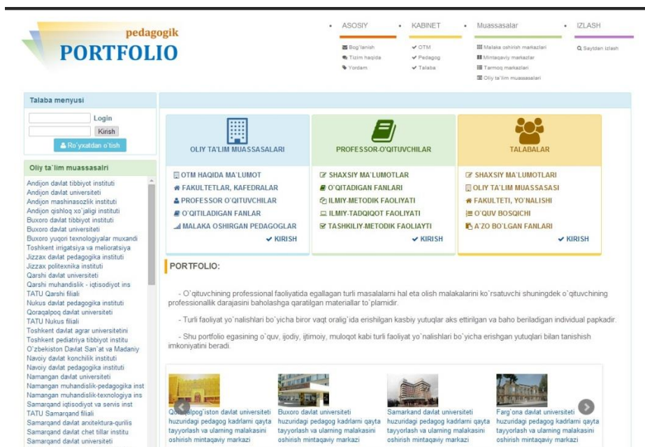
Расм 1. Электрон портфолионинг бош саҳифаси кўриниши

Мазкур жараёнда педагогларнинг электрон портфолио яратишдаги фаолиятини қуйидагича ташкил этиш мақсадга мувофиқ: биринчидан, педагоглар портфолиоси дастурий платформаси яратилади ва унинг имкониятлари билан барча педагоглар таништирилади; иккинчидан, педагоглар ўзларига тегишли касбий маълумотлар ва таълим ресурсларни шакллантириб дастурий платформага жойлаштиришлари ташкиллаштирилади;